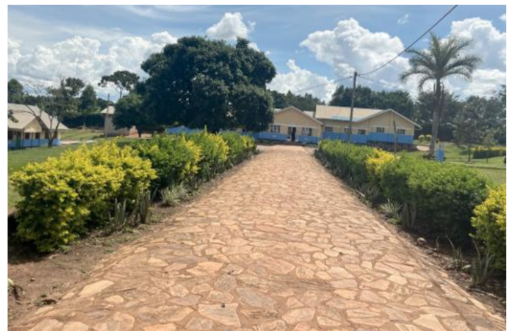
Schulgelände vor der Zoe-Grundschule

Zu den Verbesserungen der zurückliegenden Monate gehört auch, dass mehrere bestehende Gebäude einen neuen Anstrich bekamen und auf dem Schulgelände Bäume und Blumen gepflanzt wurden. Angelaufen ist in der Mittelschule zudem die weiterführende Jahrgangsstufe, die bis zum High