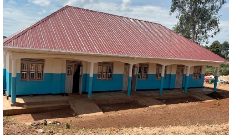
Neuer Jungen-Schlafsaal an der Zoe-Mittelschule

Die Zoe-Schulen sind 2026 gut ins neue Schuljahr gestartet. Viele Details über die Monate Januar bis März (das sog. 1. Term) hat Ordensschwester Agnes kurz nach Ostern in einem Bericht an den Zoe-Unterstützerkreis zusammengefasst. Ausdrücklich bedankt sie sich bei den „Freunden von St. Zoe“ für die segensreiche und andauernde Hilfe. Dadurch konnte jetzt Anfang des Jahres ein neues Schlafsaalgebäude für die Jungen der Mittelschule fertiggestellt werden. 25.000 Euro aus Türkenfelder Spenden der vergangenen Jahre